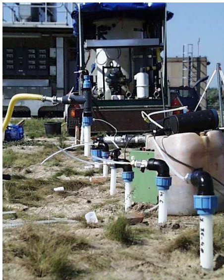
Foto: Proefopstelling bodemluchtextractiesysteem.

Bodemluchtextractie is een in-situ-saneringstechniek waarbij de bodem wordt gesaneerd door vluchtige verbindingen uit de bodem af te zuigen. De bodemlucht wordt zo vaak ververst totdat (nagenoeg) alle verontreiniging uit de bodem is verdwenen. Bodemluchtextractie wordt vaak uitgevoerd met meerdere verticale filters of horizontale drains, welke worden aangesloten op een vacuümpomp. De afgezogen lucht wordt bovengronds gereinigd. Op de foto is een proefopstelling van een bodemluchtextractiesysteem weergegeven.